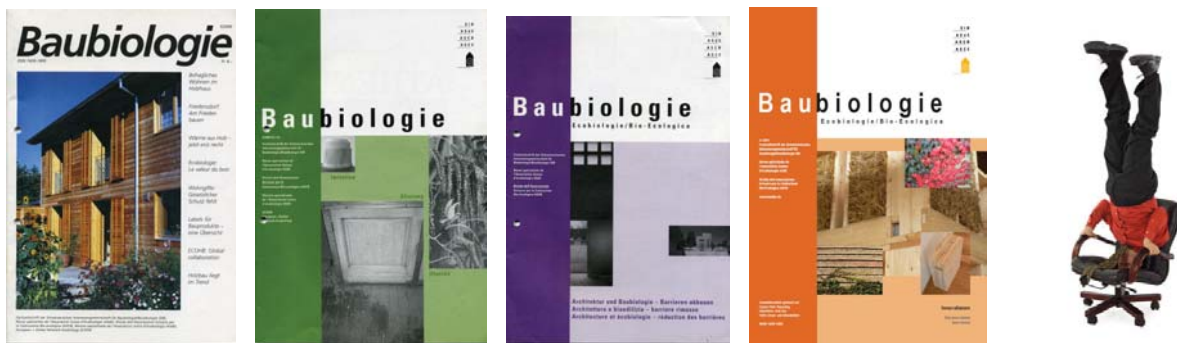
von links nach rechts: Das Cover der Zeitschrift von 1991 bis 2000; eine der wenigen Ausgaben im Jahr 2001; Wiederauflage der Zeitschrift nach der Schliessung des Institutes SIB 2003; die neueste Ausgabe der „Baubiologie“ zum Thema „Innovationen“; eigenwillige Experimente mit Möbeln (Thema im November 2011)...

Die nächste Ausgabe der „Baubiologie“ folgt bereits in Kürze zum Thema „Innovationen“, wobei die Materialwahl und das experimentelle Konstruieren im Mittelpunkt der Betrachtung stehen. Die Winterausgabe im November beschäftigt sich mit dem „Möbel“, das in seiner ergonomischen Formung und optischen Gestaltung einen allgemein unterschätzten Einfluss auf die Nutzergesundheit hat.