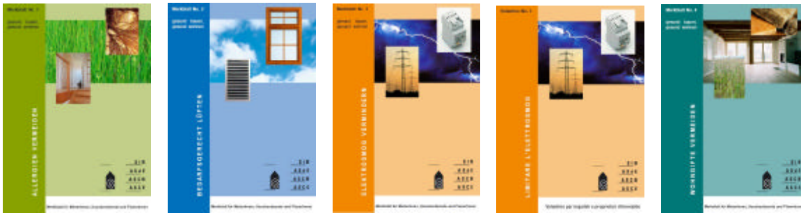
Die neue Merkblattreihe ist in Heftbindung DIN A 5 gestaltet, die Broschüren umfassen bis zu 12 Seiten.

Die SIB- Interessengemeinschaft Baubiologie hat daher in den letzten Jahren die Inhalte angepasst und wird die Merkblatt- Reihe in aktualisiertem Layout neu auflegen.