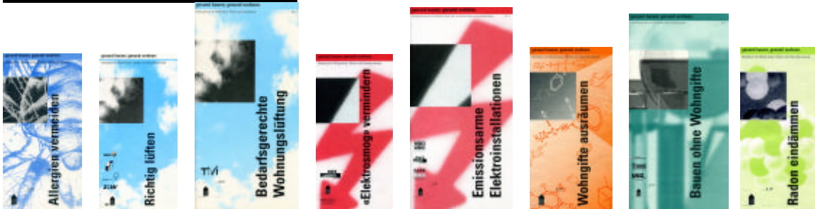
Die 1998 erstmals aufgelegten Merkblätter für „gesundes bauen und wohnen“ erfreuten sich grösster Beliebtheit.

In den Jahren 1998 bis 2000 wurde vom SIB- Institut für Baubiologie im Rahmen einer gesamtschweizerischen Kampagne die beliebte Merkblatt-Reihe unter dem Motto „Gesund bauen – gesund wohnen“ aufgelegt. Die Merkblätter erfreuten sich stets einer grossen Nachfrage, sind in-