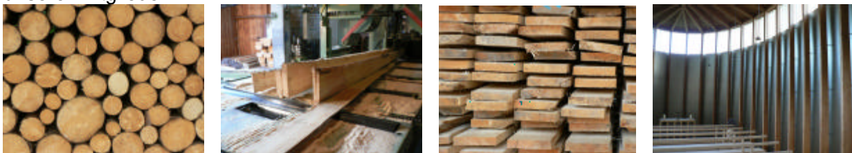
Der Baustoff Holz von der ernte bis zur Verarbeitung am Bau ist Thema der diesjährigen SIB-Fachtagung in Winterthur

Die Regionalgruppe Tessin lädt dieses Jahr auf den Montevertà ein, wo wir im Forum am Freitag, 18.4.08, nachmittags über „Die Baubiologie/Bauökologie zwischen globalisierter Wirtschaft und sozialer Utopie“ diskutieren werden. Der Abend ist angeregten Gesprächen zwischen den Teilnehmern und dem Genuss der frühlingshaften Tessiner Sonne vorbehalten. Am Samstag Vormittag wird die Generalversammlung am gleichen Ort abgehalten, wobei diesmal wieder Teile des Vorstandes neu zur Wahl stehen. Wir hoffen auf rege Teilnahme unserer Mitglieder.