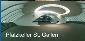
Pfalzkeller St. Gallen

Die Schweizerische Interessengemeinschaft Baubiologie/ Bauökologie veranstaltet eine ganztägige Fachtagung zum Thema „ Lebenselixier Wasser “. Die Referenten werden aus unterschiedlicher Sicht über die den ökologischen und bewussten Umgang mit der Ressource Wasser berichten: