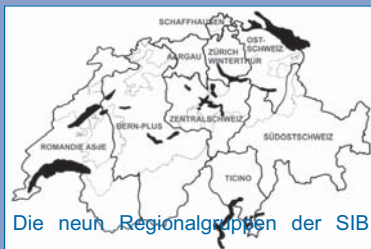
Die neun Regionalgruppen der SIB

Riethaldenstrasse 23 CH-8266 Steckborn T 0041 (0)52 212 78 83 Mail: info@baubio.ch