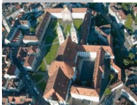
Kloster St. Gallen