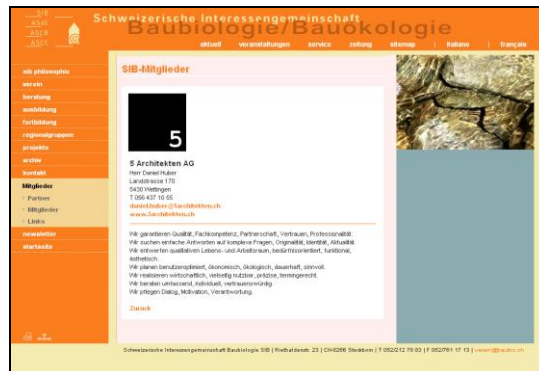
Mustereintrag mit Logo

20'000 Besucher haben die SIB Homepage letztes Jahr besucht und sich für 130'000 Seiten interessiert.